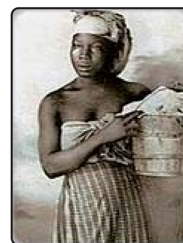
Lavé lenj-aw an rivyè, lavé loto-aw an rivyè, ka salòpté dlo-la pou on bon ti moman!

Sans toutefois renoncer à ses besoins, l'homme doit impérativement, pour sa propre qualité de vie, retrouver sa juste place au sein de la nature, dans un monde à partager et à respecter durablement.